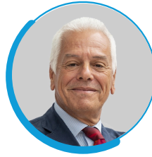
GOVERNATORE LINO PIGNATARO